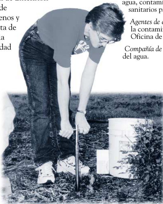
Muestreo de tierra para determinar si necesita fertilizantes.

Compañía de servicios de agua local – para obtener información sobre la conservación del agua.