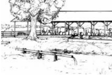
Una fosa sanitaria para los desperdicios de vacas lecheras.

Ponga los desperdicios de sus vacas lecheras, cerdos y gallinas en lagunas . Las lagunas son como pequeños lagos. Puede echarle el agua de estas lagunas a sus sembradíos.